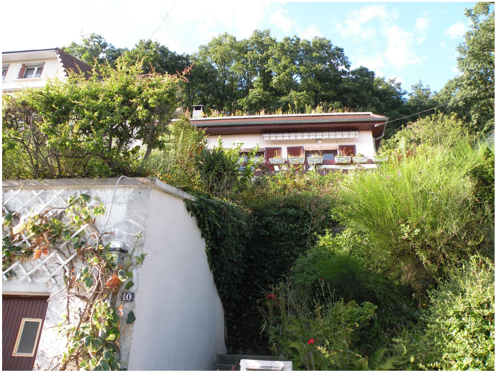
Maison vue de la rue (garage à droite)