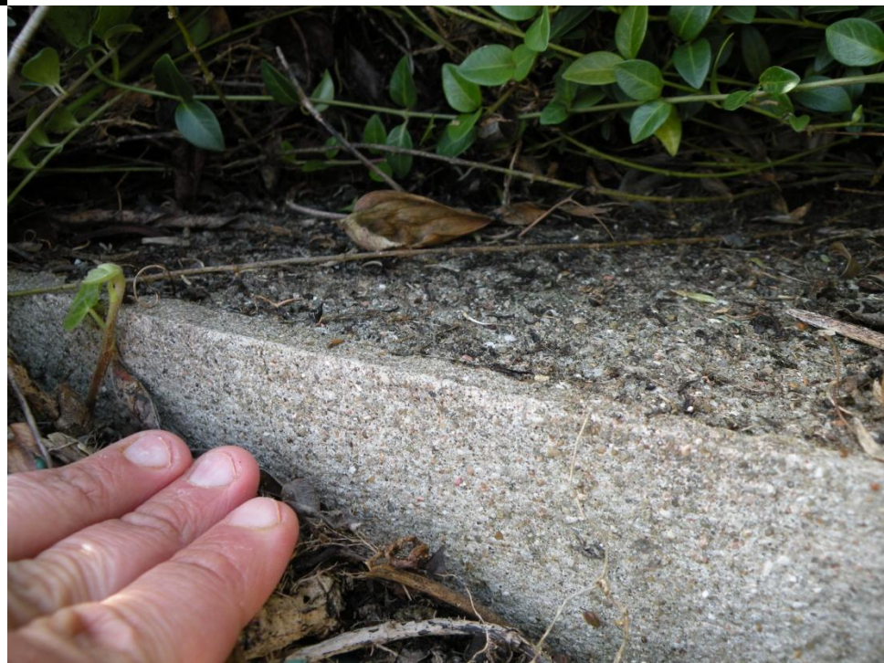
Exemple Parpaing supérieur du mur longeant l'escalier