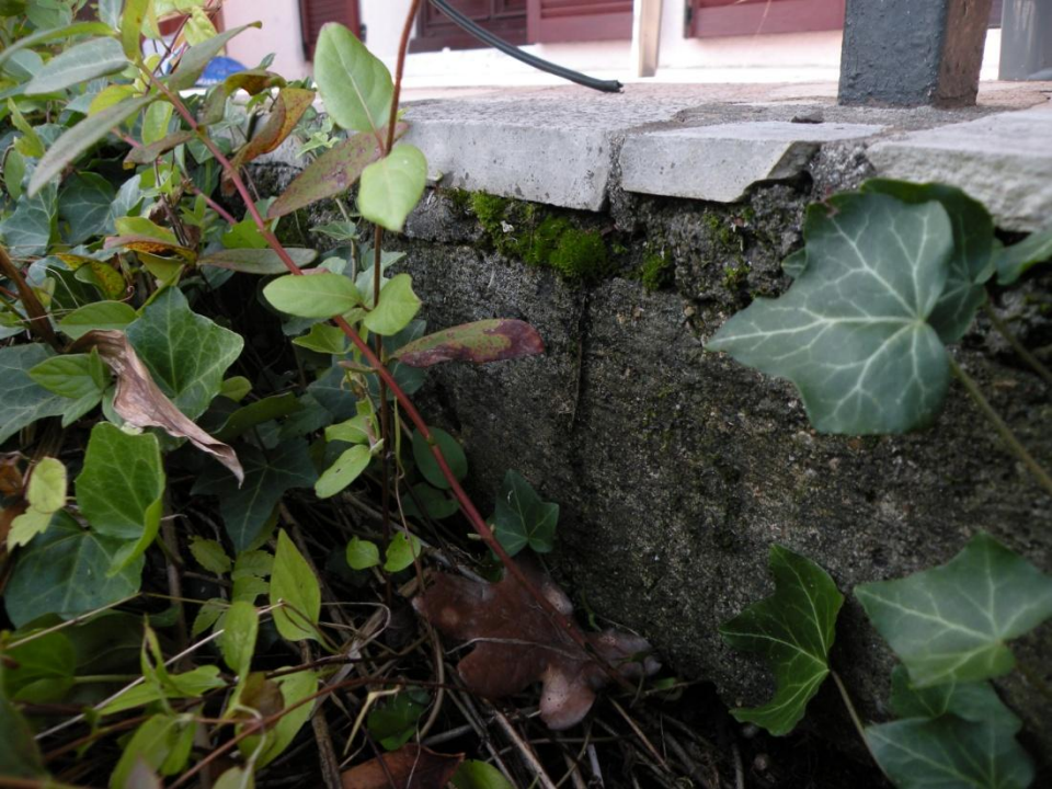
Limite frontale de la terrasse actuelle en dur Dessous terre et cailloux