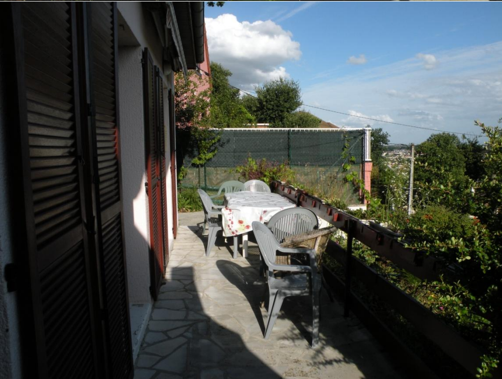
Terrasse actuelle vue du haut des escaliers (BBQ au fond)